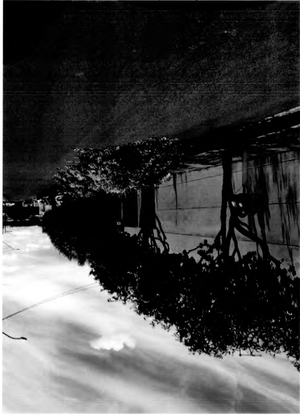
RUA CAPITÃO FELICIANO RACY