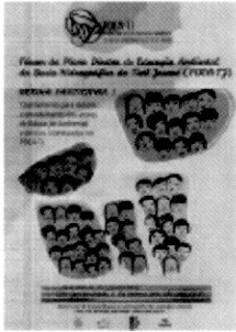
cartaz_forum_Sao Carlos.png 1042K