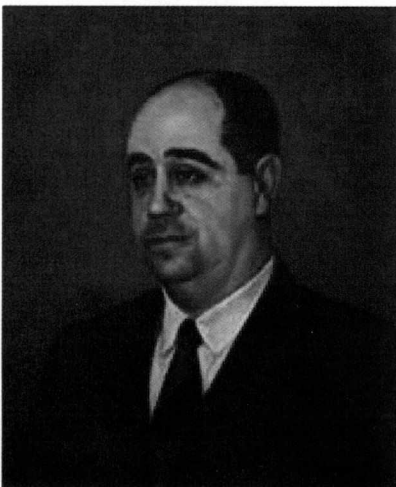
Obra de Luiz A. Fiore Óleo sobre tela , 50 x 60 cm (sem data)

Período na Presidência da Assembléia Legislativa de São Paulo: 1954/1955