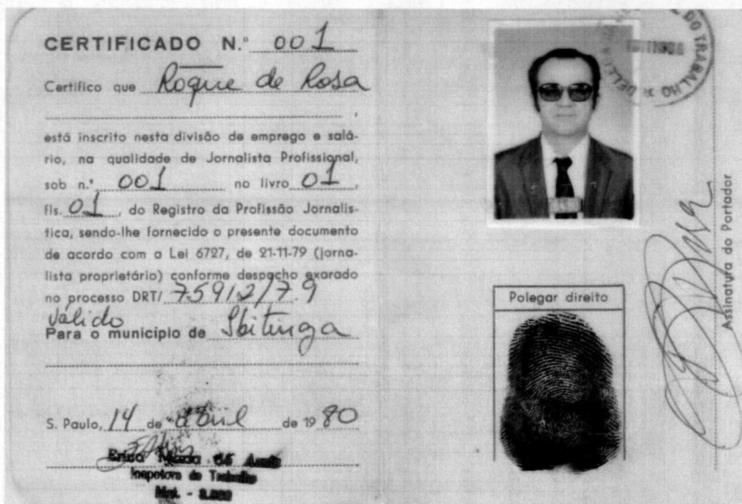
Registro Oficial que regulamentou a profissão de jornalista no estado de São Paulo. Registro 1, livro 1, folha 1.