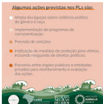
Maré 5.jpg 131K