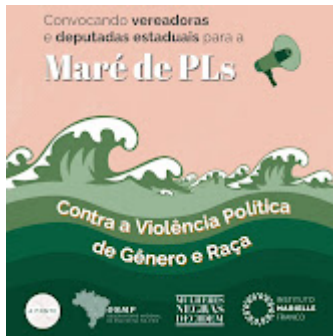
Maré 1.jpg 107K