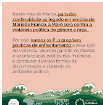
Maré 4.jpg 145K