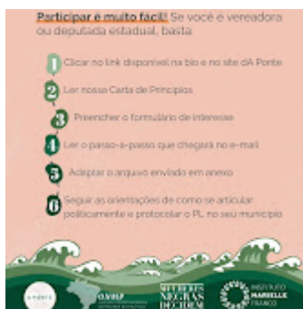
Maré 6.jpg 127K