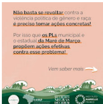
Maré 2.jpg 129K